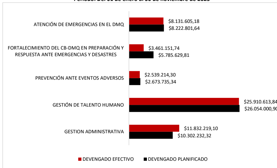
Gráfico No. 2 Devengado planificado vs ejecutado Período: Del 01 de enero al 30 de noviembre de 2025