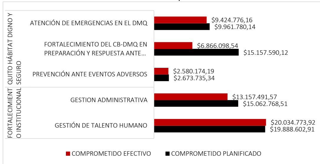
Gráfico No. 1 Comprometido planificado vs ejecutado Período: Del 01 de enero al 30 de septiembre de 2025

Fuente: Cédula Presupuestaria-Sistema Financiero Contable CB-DMQ con corte al 30-09-2025 extraída el 02-10-2025 a las 12:30 pm - Elaborado por: Dirección de Planificación